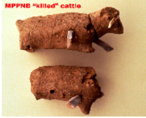
دمى ثيران غرست في أجسادها نصلات صوانية حوالي ٨٠٠٠-٧٥٠٠ قبل الميلاد

٣. الدمى الإنسانية والحيوانية عثر في قرية عين غزال على عدد كبير من الدمى الطينية ذات الأشكال الأدمية أو الحيوانية. أما الأشكال الأدمية الأنثوية؛ فكان بعضها تمثيلاً لأنثى في حالة حمل أو ولادة. وهذا برأينا دليل على اهتمام الناس آنذاك بالخصوبة والتكاثر، وعلى ما كان للمرأة من وضعية خاصة في المجتمع نظراً إلى دورها الرئيس في التكاثر البشري، لا سيما إذا ما أخذنا بعين الاعتبار طبيعة المجتمع الزراعي الذي يتطلب كثيراً من الأيدي العاملة. أما الدمى الحيوانية؛ فكانت غالبيتها لحيوانات بقرية لا سيما الثيران. وقد عثر على بعض الدمى الحيوانية التي غرست في أجسادها شفرات وسكاكين صوانية إشارة إلى تقديم الحيوانات قرابيناً للآلهة.