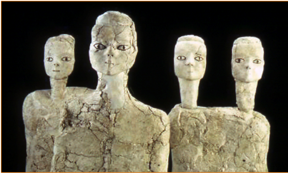
تماثيل برأسين حوالي ٨٠٠٠-٧٥٠٠ قبل الميلاد

معاهد السميثسونيان في نيويورك، وأعيدت غالبيتها إلى الأردن بعد الترميم. ولا نبتغي هنا وصف التماثيل أو تكوينها بقدر ما نود أن نخرج إلى أهميتها وطبيعتها، إذ تساءل باحثون كثير عما إذا كانت ذات ارتباط بمعبودات أمن بها سكان عين غزال، ولا يزال هذا الأمر يراوح بين أخذ ورد الدارسين، إلا أننا نرجح صلة تلك التماثيل بارتباطات الناس العقائدية، ونرى أن سكان عين غزال، وخلال الألف الثامن قبل الميلاد وما تلاه، مارسوا شعائرًا وطقوسًا ارتبطت وثيقًا بعقيدة لا نعرفها، فلا مدونات كتابية آنذاك تسعف في فهم معتقدات الناس وذلك لعدم معرفة الناس بالكتابة بعد؛ فربما نصبوا التماثيل لآلهة عبودها، وقدموا لها الأضحيات والقرابين، و أنشأوا لها مبان كرّست لثعبد فيها وتقام في حضرته الشعائر والطقوس.