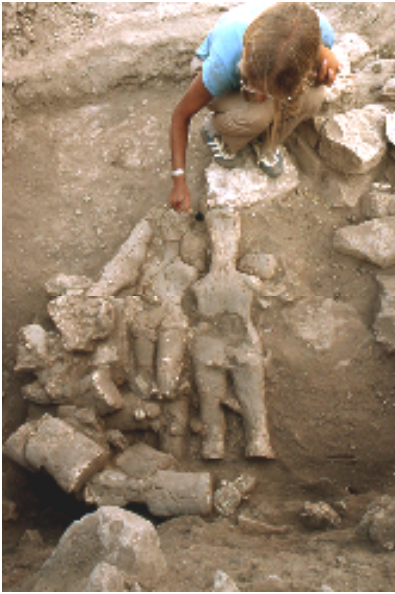
المجموعة الأولى من التماثيل ١٩٨٣ حوالي ٨٠٠٠-٧٥٠٠ قبل الميلاد

كُشف في عين غزال فيما بين الأعوام ١٩٨٣ و١٩٨٥ عن مجموعتين من التماثيل الجصية الأدمية، والتي أرخت إلى حوالي ٧٧٧٠ قبل الميلاد، موضوعة على نحو مرتب في حفر أعدت خصيصاً لهذا الشأن. وقد صنعت هذه التماثيل من مادة الجص، وهي مادة هشة وقابلة للتفتت، لذا بُعثت المجموعة الأولى من تلك التماثيل إلى معهد الآثار البريطاني في لندن لترميمها وصيانتها، وبُعثت المجموعة الثانية إلى