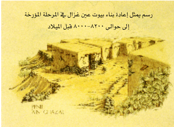
رسم يمثل إعادة بناء بيوت عين غزال في المرحلة المؤرخة إلى حوالي ٨٢٠٠-٨٠٠٠ قبل الميلاد

ومنذ تأسيس قرية عين غزال قبل حوالي عشرة آلاف عام، ظلت عمّان مأهولة بالسكان حتى يومنا هذا، فمن منا لا يعرف أن "ربة عمون" هي عاصمة العمونيين، وأن فيلادلفيا هي إحدى المدن العشر (الديكابوليس) وإحدى المدن الرئيسية في العصر الروماني، وأن القصر الأموي الذي يطل من على جبل القلعة هو شاهد على دور عمّان في العصور الإسلامية؛ فلم لا