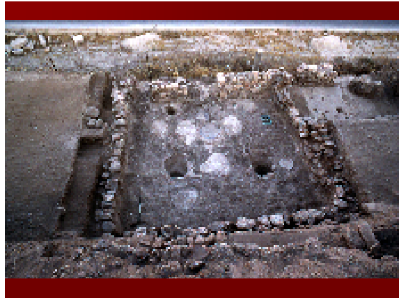
منزل من الفترة بين حوالي ٨٢٠٠ - ٧٥٠٠ قبل الميلاد

كشفت التنقيبات الأثرية في عين غزال عن تباين في تخطيط المساكن وطبيعتها بين مرحلة وأخرى؛ إذ تكونت الوحدة المنزلية خلال مرحلة الاستقرار الأولى في الموقع (حوالي ٨٢٠٠ وحتى ٧٥٠٠ قبل الميلاد) من غرفة واحدة مربعة الشكل مساحتها حوالي ٥ م × ٥ م. إلا أن السكان، ومع مرور الوقت، أجروا تعديلات على مساحتها بما يتلاءم وطبيعة معيشتهم. وفي مكان يقابل مدخل المنزل، أقيم في وسط المصطبة موقد حفر في الأرضية المقصورة المدهونة باللون الأحمر. كما رُفِع سقف المنزل على أعمدة خشبية ثبتت في حفر في أرضية المصطبة.